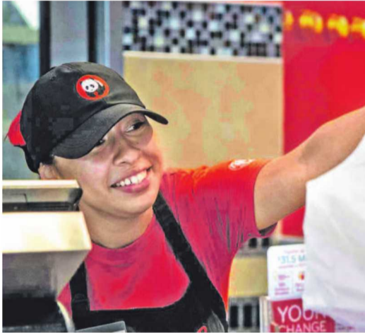
US-based Asian fast-casual chain Panda Express plans to enter India in 2027.

Kaushish said Chinese cuisine is embedded in India's food delivery and dining culture, and presents a sizeable white space opportunity for organized